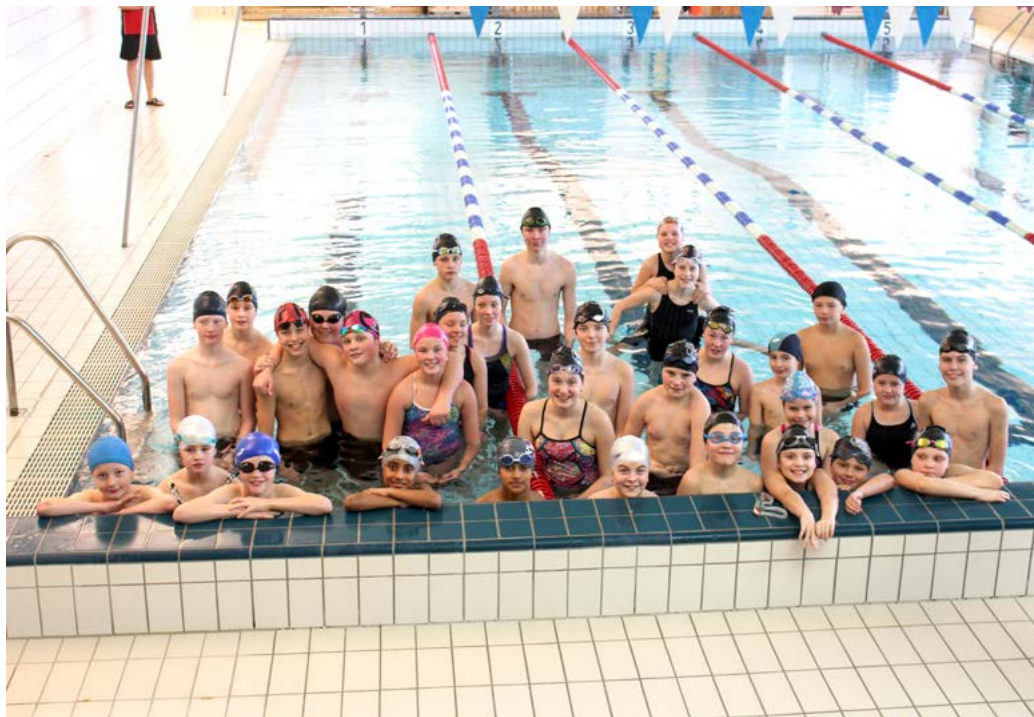
Denne gode gjengen deltok på svømmestevne.

Eidsvoll svømmeklubb fylte 50 år og arrangerte stort svømmestevne. Klubben ble stiftet i 1965 av Ralph Harris. Klubben har i dag rundt 700 medlemmer og vil måle seg med de store klubbene.