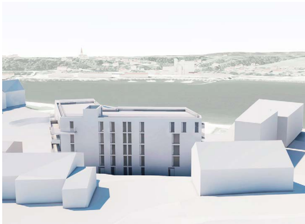
Slik er boligblokka illustrert fra nordvest.

Bjørn Dæhlie fortsetter i investere i Sundet. Nå har han kjøpt gamle Solli pensjonat, og planlegger et leilighetsbygg med 33 leiligheter på tomten. Blokka er planlagt i fem etasjer og målet er å realisere så snart den nye områderegeringsplanen er klar.